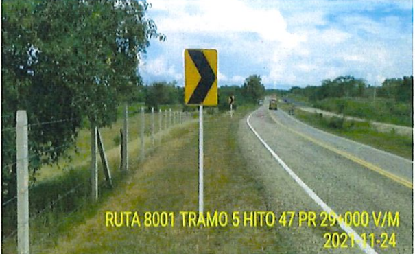
Figura 3 Registro Fotográfico