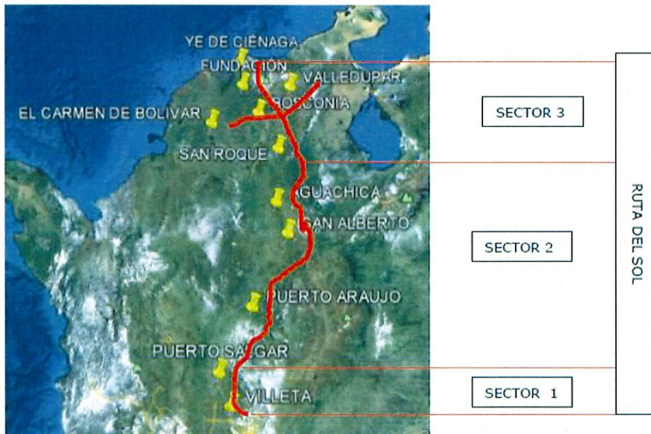
Figura 1. Ruta del sol