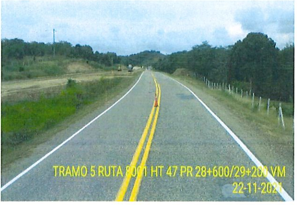
Figura 3 Registro Fotográfico