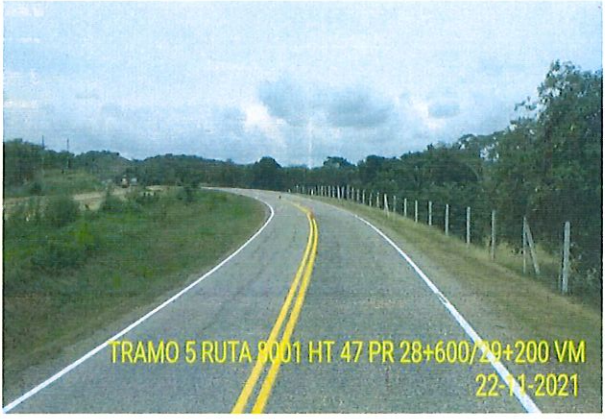
Figura 3 Registro Fotográfico