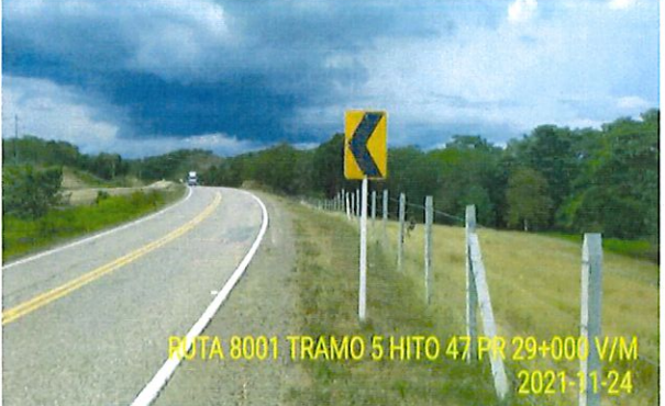
Figura 3 Registro Fotográfico